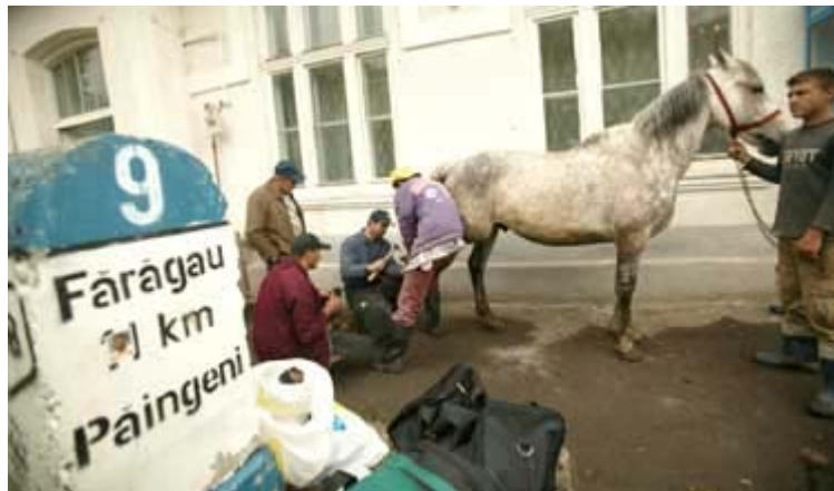
FOTOREPORTAJ de KARINA KNAPEK - Click pe imagine

Gyuri privi pe ferestruica oblica a odaii de deasupra grajdului si vazu oameni si cai, cai si oameni perindandu-se spre centrul comunei. Auzi si forfota care razbatea pana la el in batatura si atunci decise sa mearga in sat sa vada ce se intampla. "O fi de bine sau de rau?" Curiozitatea il mana catre centru, la caminul cultural. Zeci de cai si stapanii lor. Zgomot de potcoave batute si galceava multa.