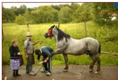
MANDRIA SATULUI. Cimlok, cel mai frumos exemplar

Potcovitul este esential in prelungirea vietii sau a capacitatii de munca a unui cal. Daca acesta traieste maximum 40 de ani, la 8 ani este in plina capacitate de munca, iar la 15-20 incepe procesul de imbatranire, cand calul deja nu mai poate fi folosit la munci grele. Acestea, in conditiile in care calul ar fi potcovit corect la sase-opt saptamani si ingrijit corespunzator. Dar, cel putin in Mures, lucrurile nu stau chiar asa. Sunt oameni care nu si-au mai potcovit caii de ani buni. Si atunci picioarele le obolesc. Si desi cei mai multi sunt puternici, cai de tractiune, folositi la munca pe dealuri, la 10-12 ani picioarele deja sunt obosite, ei sunt imbatraniti inainte de vreme, iar proprietarii ori ii tin in curte de placere, ori ii duc la abator.